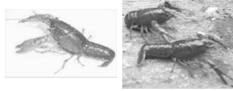
Lobster Hias : Ungu dan Merah

Lobster Air Tawar Jenis Clarkii. Eksotik dan menarik. Sangat cantik untuk menghiasi akuarium dirumah Anda