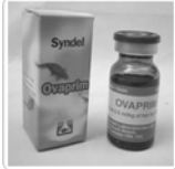
Ovaprim Syndel 10ml .. Rp 180.000

Telur Artemia. Mengandung protein tinggi. Banyak digunakan peternak pembibitan ikan