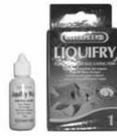
Liquifry .. Rp 45.000

Menumbuhkan infusoria sebagai pakan burayak ikan yg bertelur. Banyak digunakan pada budidaya cupang