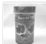
Super Betta .. Rp 15.000

Hormon untuk reproduksi ikan. Efektif untuk menstimulasi pelepasan telur pada induk ikan betina dan menambah jumlah sperma pada induk ikan jantan.