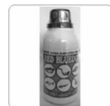
Red Bluedox 250 ml .... Rp 16.000

Cacing sutra kering. Terbuat dari cacing sutra segar. Sangat disukai oleh ikan peliharaan Anda