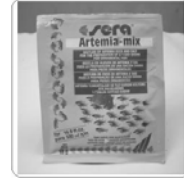
Sera Artemia Mix .. Rp 18.000

Menumbuhkan infusoria sebagai pakan burayak ikan yang bertelur. Banyak digunakan pada budidaya cupang