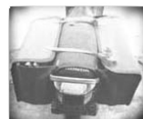
Tas Motor Ekonomis .. Rp 60.000

Digunakan oleh peternak pembibitan lele untuk melakukan pensortiran. Tersedia dalam ukuran : 2-3,3-4,4-5,5-6,6-7,7-8,8-9,9-10,10-11,11-12 1 Set = 10 ember